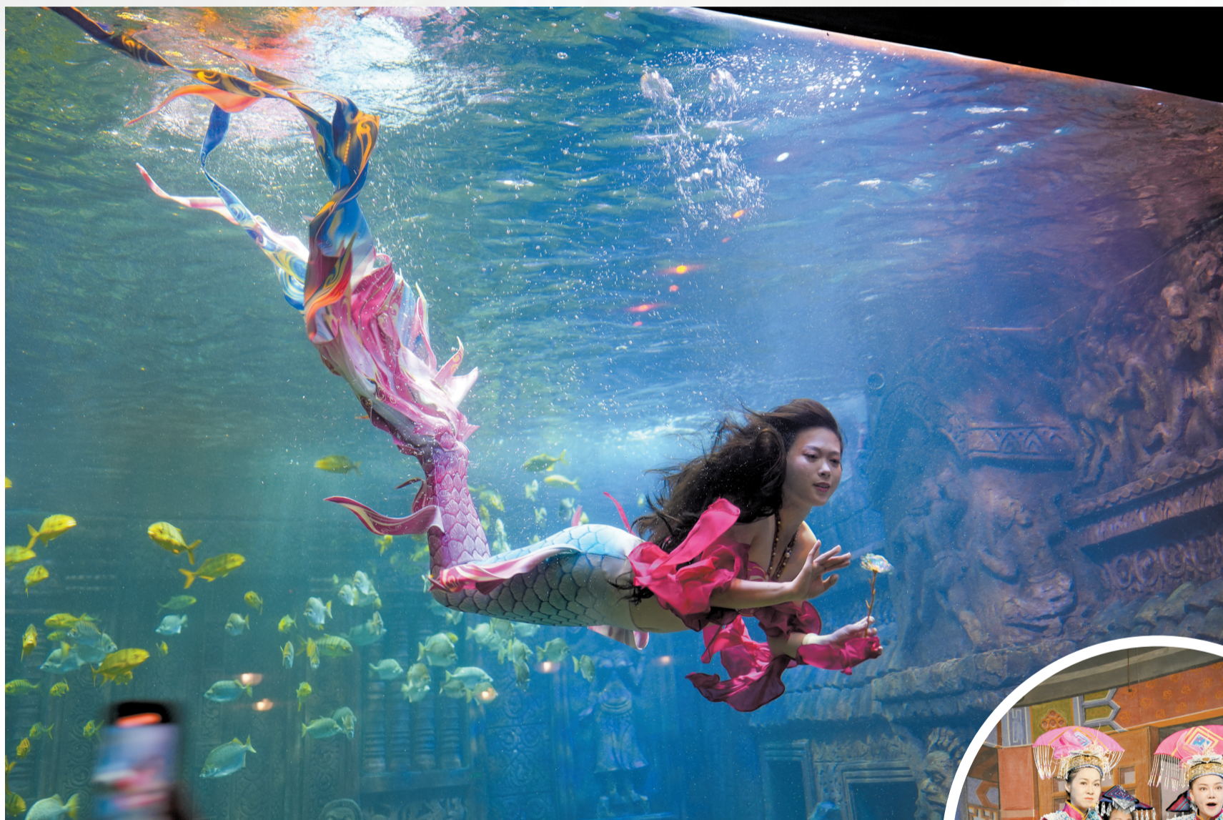
北海海底世界的美人鱼表演。

展现了“一带一路”经贸活力；北海合浦汉代文化博物馆内，丝路遗珍诉说着海上丝绸之路的往昔辉煌…… 这场跨越山海的热爱之旅，用新媒体视角，记录下中国与东盟国家在生态与文化领域的共生共荣，不仅架起了一座文旅传播与人文交流的桥梁，更是扩大传播声量讲好广西故事的一次创新尝试。