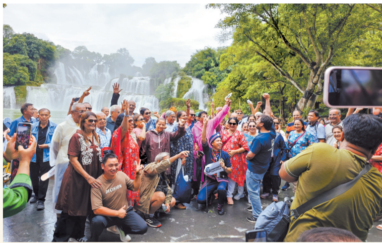
外国旅行团在德天跨国瀑布前合影留念。