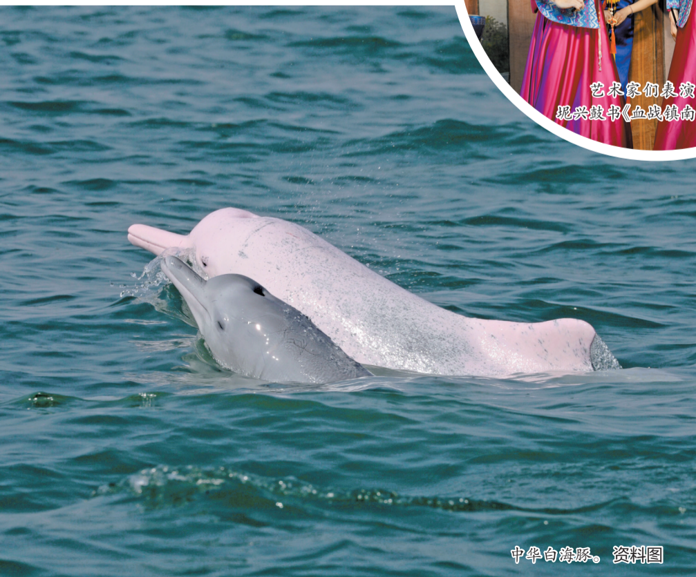
中华白海豚。资料图