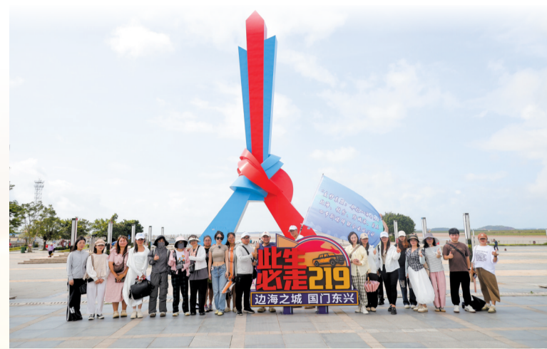
采风团在山海相连地标广场合影留念。