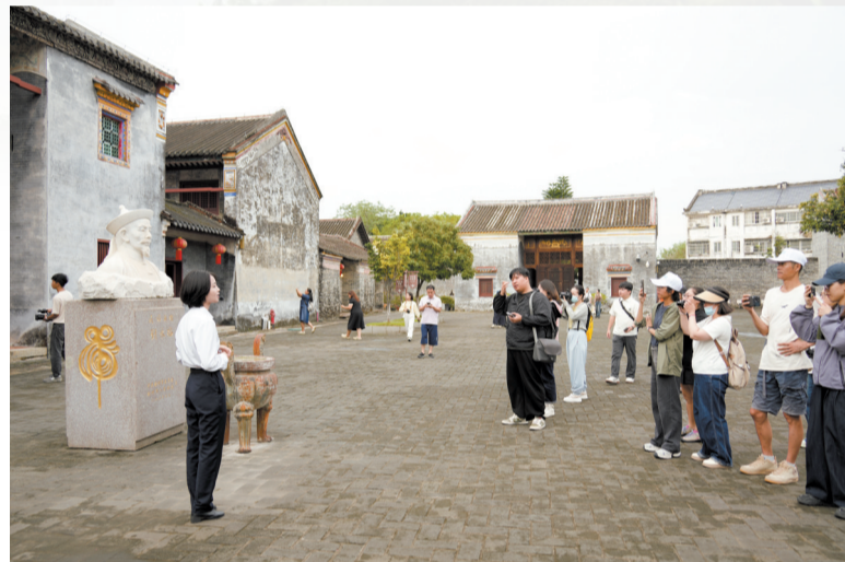
采风团来到刘永福旧居参观。