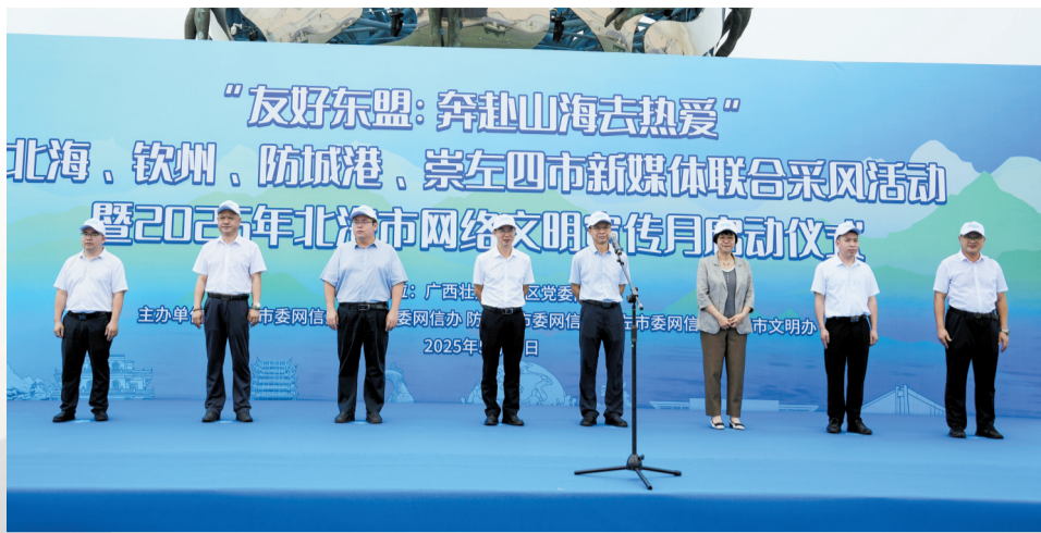
四市新媒体联合采风活动启动仪式现场。