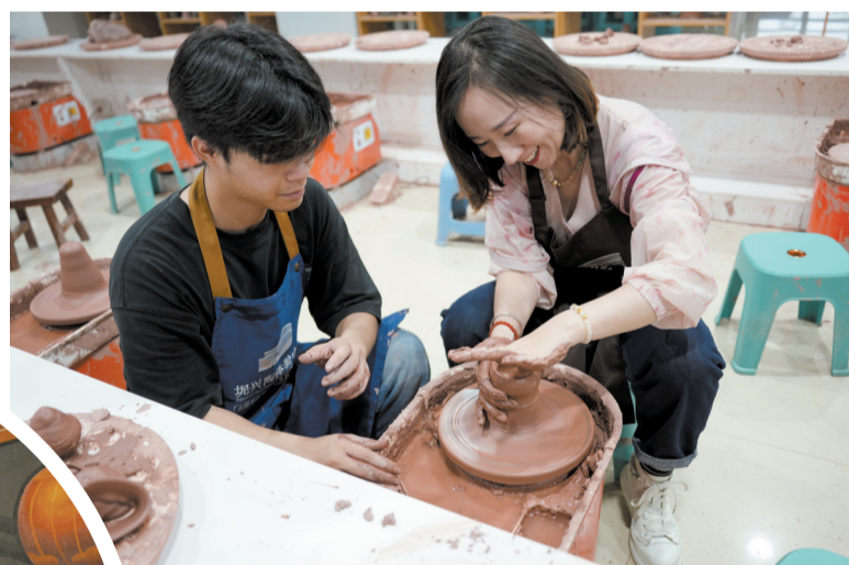
坭兴陶体验中心的老师现场指导采风团成员制作坭兴陶。