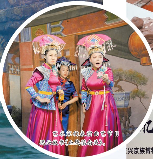
艺术家们表演曲艺节目 坭兴独书《血战镇南关》。